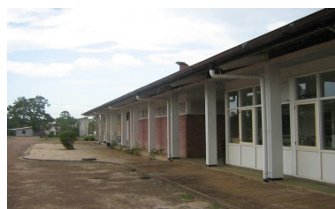
Centre de santé d'Albina, ville frontalière à Saint-Laurent

En raison d'une offre de soins limitée sur la rive Surinamaïse du fleuve, la population Surinamaïse se dirige souvent vers le Centre Hospitalier de l'Ouest Guyanais (CHOG) situé à Saint-Laurent en Guyane, ainsi que vers les hôpitaux de Kourou et de Cayenne, dans une moindre mesure.